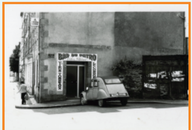
Le "Bar du Patro" avant sa vente en 1992