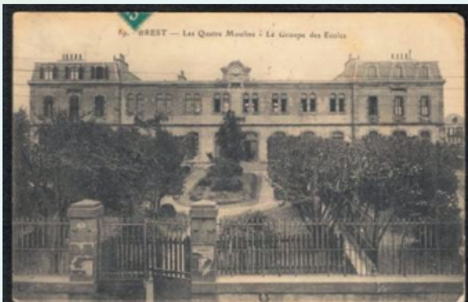
Photo ancienne de l'école des Quatre-Moulins, où la bibliothèque a été transférée en 1986.