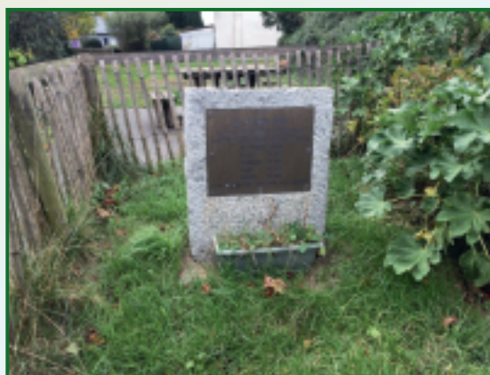
Rue Stendhal, à Kerargaouyat derrière le centre omnisports de la Résistance, on peut voir, une plaque commémorative avec les prénoms des 4 enfants de Kerargaouyat

Dans les jours qui ont suivi, une enquête dans les puits du quartier, notamment à l'entreprise Wittersheim, a décelé du gaz de ville au-dessus du niveau d'eau. L'hypothèse retenue est la présence de gaz au-dessus d'une nappe phréatique formant un petit lac. À l'origine, une fuite de gaz, qui s'infiltré dans le sol et se retrouve confiné dans la partie vide au-dessus de l'eau. Les mois d'avril et de mai sont pluvieux et le niveau de l'eau remonte. Le gaz comprimé s'enfuit dans les veines du sol et se retrouve au plus bas dans les puits et l'abri de Keroudot.