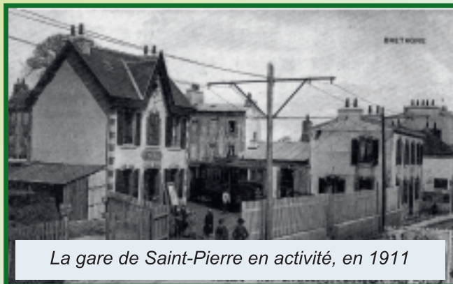
La gare de Saint-Pierre en activité, en 1911

Cette gare était le point de départ du tramway pour Le Conquet, et plus tard, vers Recouvrance. On l'appelait "le train électrique" pour sa capacité à s'équiper jusqu'à 2 remorques. Celles-ci, suivant la météo, étaient fermées ou ouvertes. Ce tram, il ne