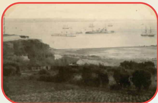
Vue de la rade de Brest depuis Kerangoff, avant la construction des HLM en 1952.

"Des fenêtres de la chambre où je dormais, par-dessus les arbres, on apercevait toute la rade." ou "En plus des grandes vacances, celles d'été, que nous passions toujours à Kerangoff chez notre grand-mère maternelle [...], nous avons commencé à prendre aussi des petites vacances d'hiver, dans le Jura, [...]" ("Le Miroir qui revient", 1985, p.105).